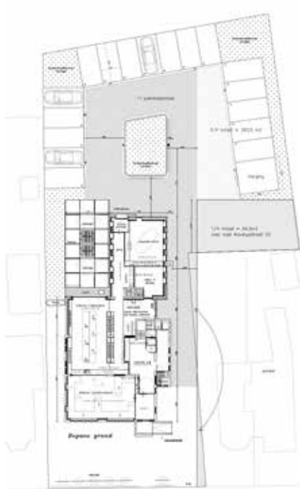
BIBLIOTHEEK KONINGSTRAAT APPINGEDAM