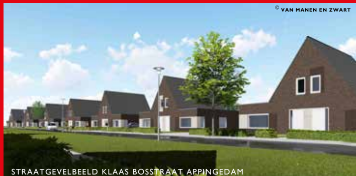
STRAATGEVELBEELD KLAAS BOSSTRAAT APPINGEDAM

consequent uitgewerkt. Het gevolg was bijvoorbeeld dat de prominente hoek gesloten was, daar waar je juist meer openheid en expressie zou verwachten. De commissie adviseerde om de detaillering en variatie van de gevels te beperken. De opmerkingen leidden tot aanpassing van het ontwerp en aansluitend een positief advies van de rayonarchitecten.