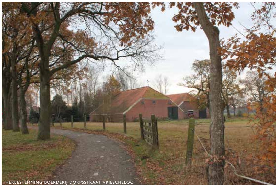
HERBESTEMMING BOERDERIJ DORPSTRAAT VRIESCHELOO