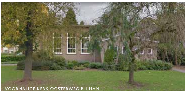
VOORMALIGE KERK OOSTERWEG BLIJHAM