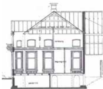
DOORSNEDE VOORHUIS HOOFDWEG