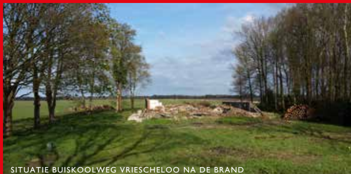
SITUATIE BUISKOOLOWEG VRIESCHELOO NA DE BRAND

het ontwerp en de speciale plek die het aan de cultuurhistorische weg inneemt. De commissie adviseerde nog wel om de massieve houtconstructie nog meer te benadrukken. Hiermee wordt het bijzondere karakter van deze invulling duidelijk zichtbaar.