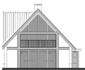
WONING HOOFDWEG BLIJHAM