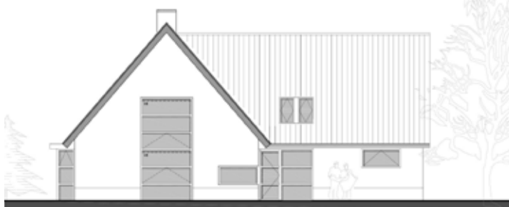
WONING HOOFDWEG BLIJHAM