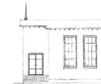
VERVANGING RAAM DOOR DEUR