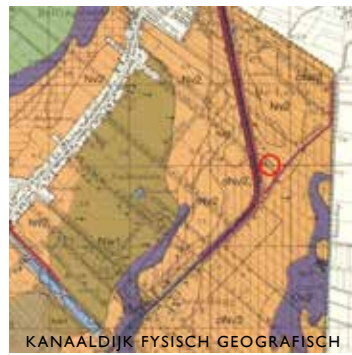
KANAALDIJK FYSISCH GEOGRAFISCH