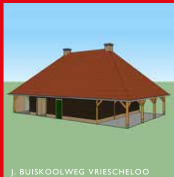
J. BUISKOOLWEG VRIESCHELOO