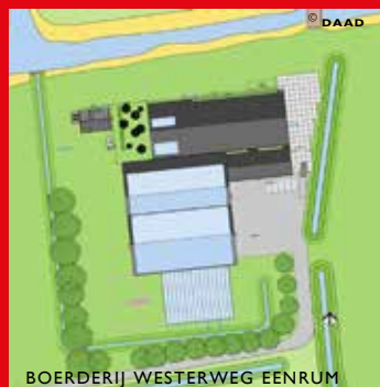
BOERDERIJ WESTERWEG EENRUM