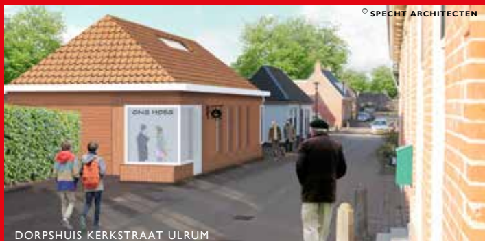
DORPSHUIS KERKSTRAAT ULRUM

• Het plan voor sloop en vervangende nieuwbouw van een loods aan de Dijksterweg bij Hornhuizen leidde ook tot het besluit om deze nieuwe loods aan de overzijde van de weg te bouwen. De nieuwe loods krijgt een markant uiterlijk doordat de wanden voor een groot deel van een donkere, houten beplating worden voorzien.