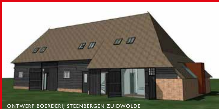
ONTWERP BOERDERIJ STEENBERGEN ZUIDWOLDE

bestaande gevelopeningen worden gebruikt om voldoende daglicht in de woningen te creëren. De monumentencommissie was positief over dit plan en adviseerde om aansluitend een erfinrichtingsplan te laten maken.