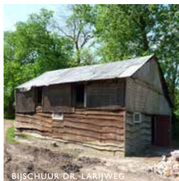
BIJSCHUUR DR. LARIJWEG