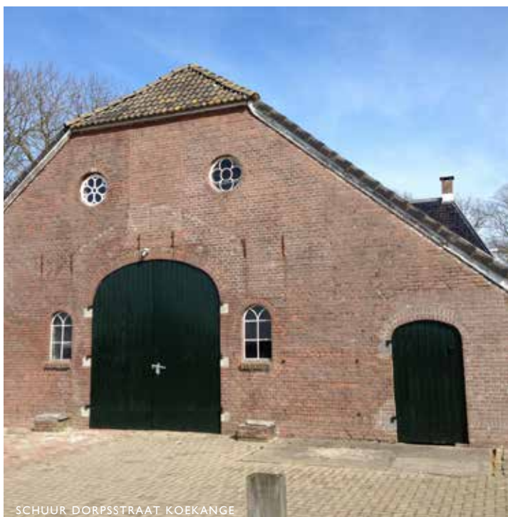
SCHUUR DORPSSTRAAT KOEKANGE