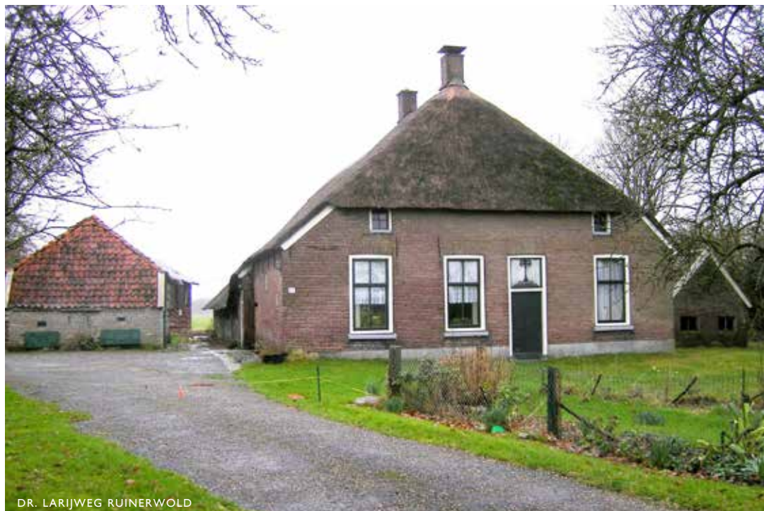
DR. LARIJWEG RUINERWOLD