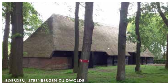
BOERDERIJ STEENBERGEN ZUIDWOLDE