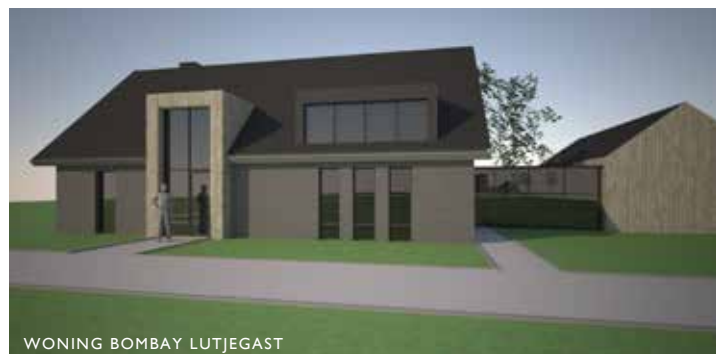
WONING BOMBAY LUTJEGAST