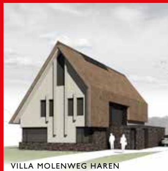
VILLA MOLENWEG HAREN