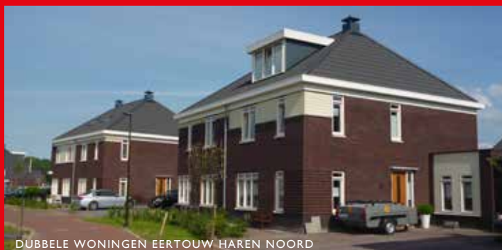
DUBBELE WONINGEN EERTOUW HAREN NOORD

een andere architect in. Het nieuwe schetsontwerp voldeed volledig aan de verwachtingen en de commissie sprak haar waardering hiervoor uit. • Het ontwerp voor een nieuwe villa/schuurwoning aan de Kampsteeg in Glimmen werd door de welstandscmissie in eerste instantie voorzien van de opmerking dat de gevel aan de straatzijde te veel leek op een achterzijde. Het ontwerp werd daarop aangepast en goedgekeurd.