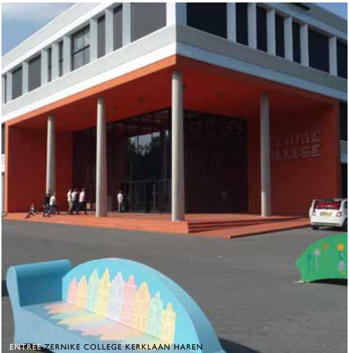
ENTREE ZERNIKE COLLEGE KERKLAAN HAREN