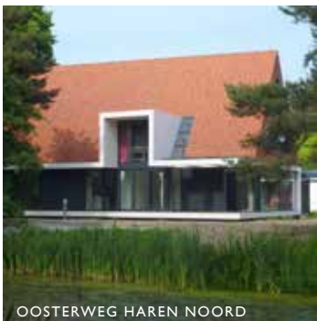
OOSTERWEG HAREN NOORD