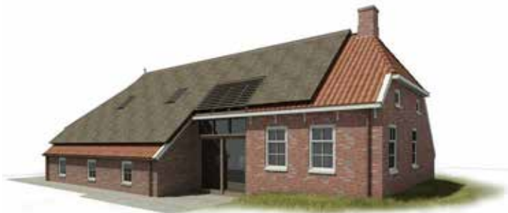
MONUMENT LUTSBORGSWEG HAREN