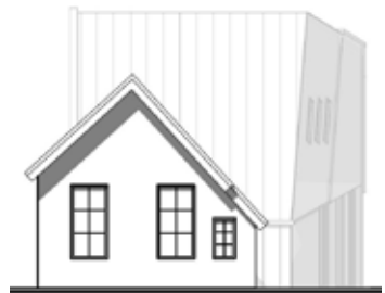
UITBREIDING POLLSELAAN GLIMMEN