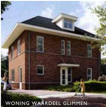
WONING WAARDEEL GLIMMEN