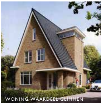
WONING WAARDEEL GLIMMEN

ONTWERP HET ZOEKENDE HUIS KOELANDSDRIFT ONNEN