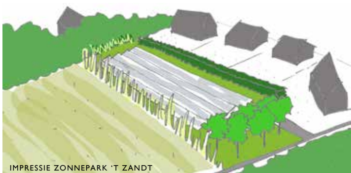
IMPRESSIE ZONNEPARK 'T ZANDT