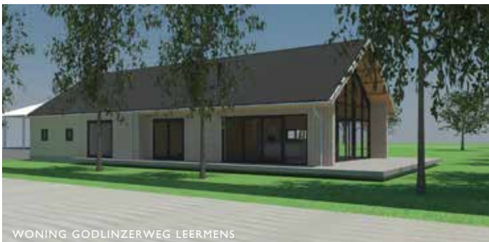
WONING GODLINZERWEG LEERMENS