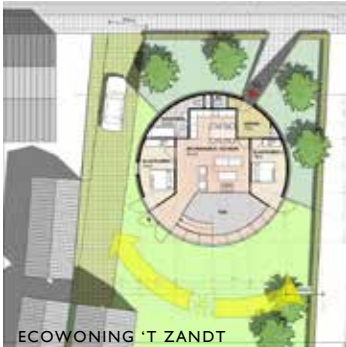
ECOWONING 'T ZANDT