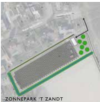
ZONNEPARK 'T ZANDT