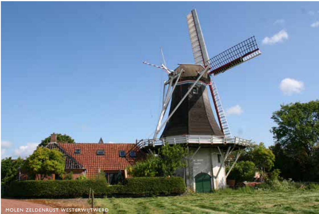
MOLEN ZELDENRUST WESTERWIJTERD