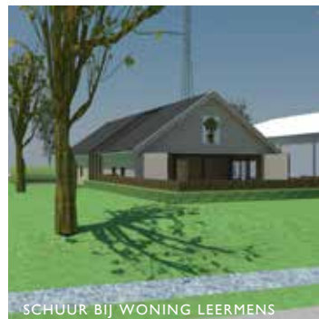
SCHUUR BIJ WONING LEERMENS