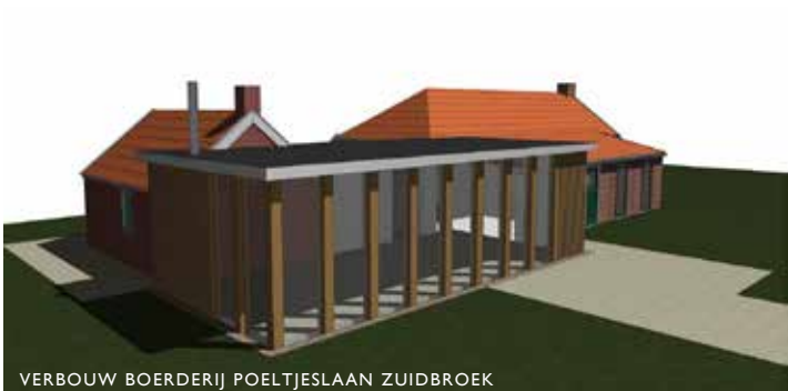
VERBOUW BOERDERIJ POELTJESLAAN ZUIDBROEK