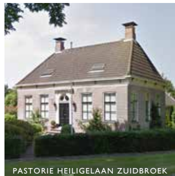
PASTORIE HEILIGELAAN ZUIDBROEK