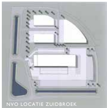
NVO LOCATIE ZUIDBROEK