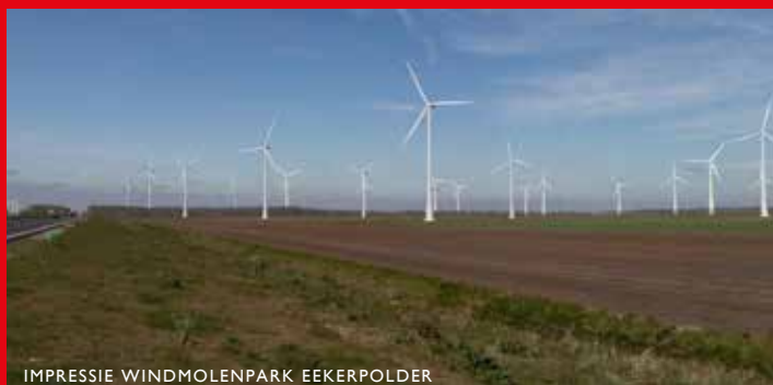
IMPRESSIE WINDMOLENPARK EEKERPOLDER

ongewijzigd bleef, leidde volgens de welstandscmissie tot een onevenwichtig beeld. De commissie adviseerde de eigenaar de hele kap te verhogen zodat ook op de verdieping een royale leefruimte zou ontstaan. De woning zou hierdoor visueel beter aansluiten bij de naastgelegen forsere woningen. De eigenaar besloot vervolgens de voorgevel te upgraden en deze daarmee beter te laten passen bij dit traditionele woningtype.