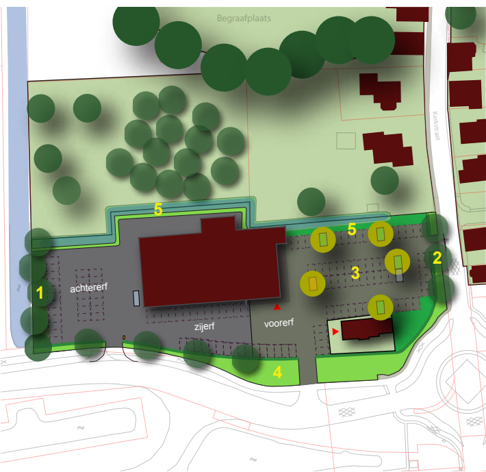
KADER INRICHTING OMGEVING ALDI ZUIDBROEK