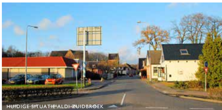
HUIDIGE SITUATIE ALDI ZUIDBROEK