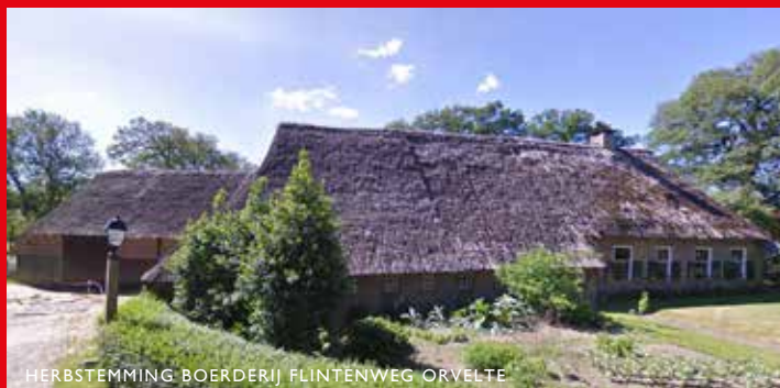
HERBESTEMMING BOERDERIJ FLINTENWEG ORVELTE

ingrepen aan de boerderij en geen dakramen. De adviezen van de commissie worden meegenomen in de uitwerking van een schetsontwerp.