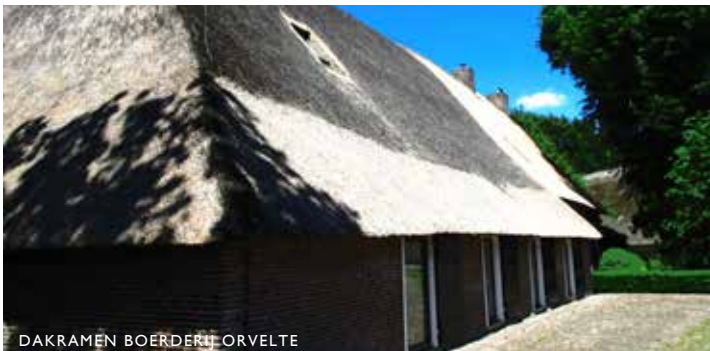
DAKRAMEN BOERDERIJ ORVELTE