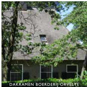
DAKRAMEN BOERDERIJ ORVELTE