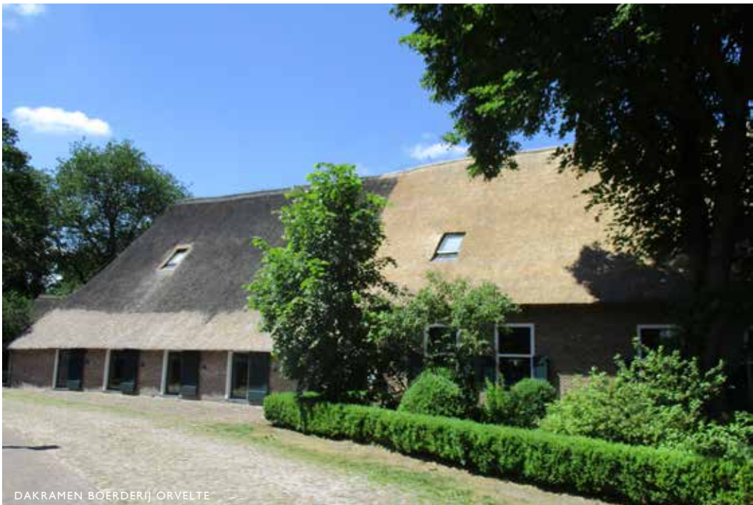
DAKRAMEN BOERDERIJ ORVELTE