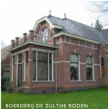
BOERDERIJ DE ZULTHE RODEN