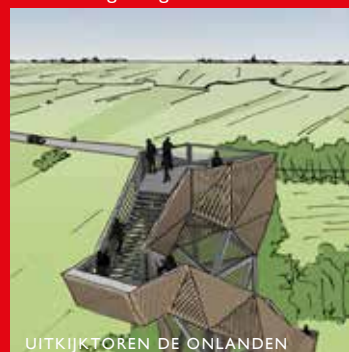
UITKIJKTOREN DE ONLANDEN