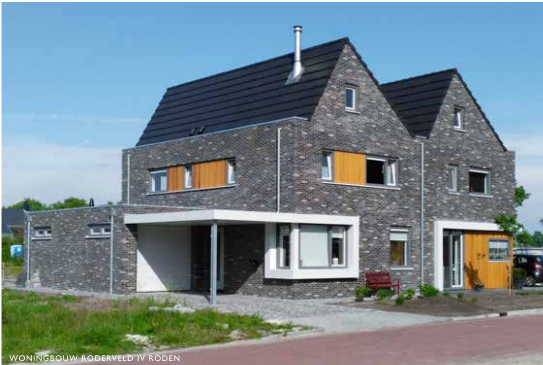
WONINGBOUW RODERVELD IV RODEN