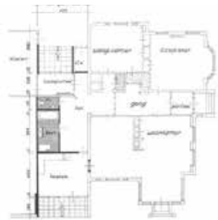
BOERDERIJ DE ZULTHE RODEN