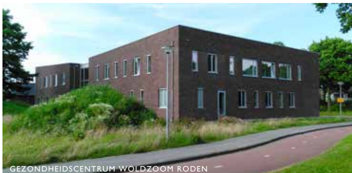
GEZONDHEIDSCENTRUM WOLDZOOM RODEN