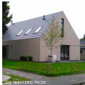
DE WESTERD PEIZE