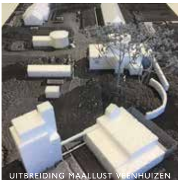
UITBREIDING MAALLUST VEENHUIZEN