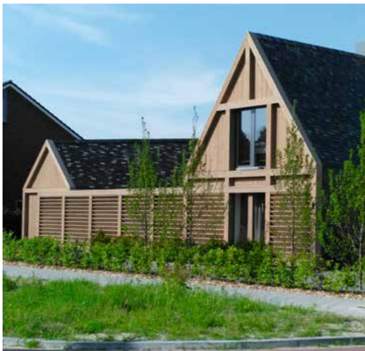
WONINGBOUW RODERVELD IV RODEN