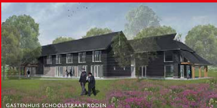
GASTENHUIS SCHOOLSTRAAT RODEN

landschap, daar waar monniken eeuwen geleden al hun toevlucht zochten, en heeft als basis een stalen draagconstructie. De trap draait in een wijde slag rondom het centrale deel van de constructie en krijgt een houten bekleding. De commissie adviseerde de constructie sterker te maken, zodat ondersteuning niet nodig zou zijn, en de houten bekleding op een meer overtuigende wijze toe te passen. Deze opmerkingen zijn in de verdere uitwerking meegenomen.