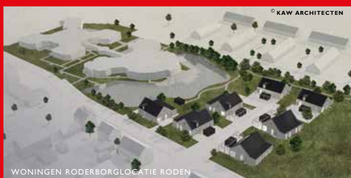
WONINGEN RODERBORGLOCATIE RODEN

over het plan voor de verbouw en uitbreiding van een vakantiewoning aan de Hoofdweg in Roderesch. De éénlaagse woning met een zadeldak wordt volledig gerenoveerd en vergroot door de kap te verlengen. De schuur naast het huis blijft behouden, maar de kleinere bouwsels op het erf worden gesloopt. Ook de directe omgeving van de woning wint hierdoor aan kwaliteit.