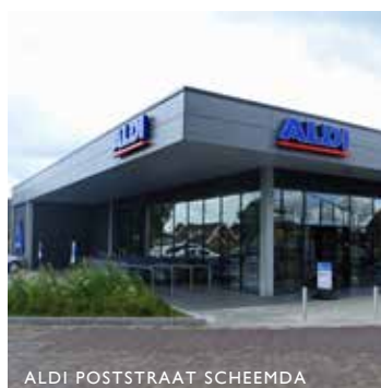
ALDI POSTSTRAAT SCHEEMDA