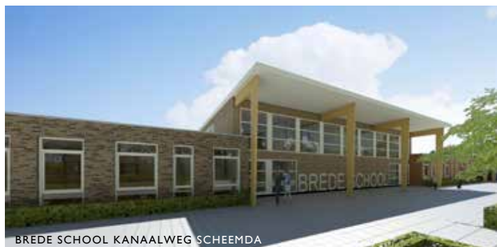
BREDE SCHOOL KANAALWEG SCHEEMDA