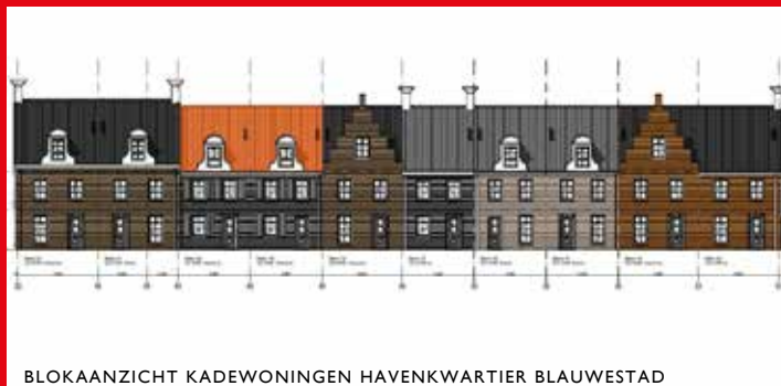
BLOKAANZICHT KADEWONINGEN HAVENKWARTIER BLAUWESTAD

locatie leent zich hier goed voor en het ontwerp dat voor deze vier woningen werd ingediend, paste in essentie dan ook goed. De welstandscmissie stuurde op onderdelen bij om een duidelijke structuur en goede uitstraling van de houten wanden te krijgen. Het resultaat leidt tot bijzondere waterwoningen in het midden van de stad.