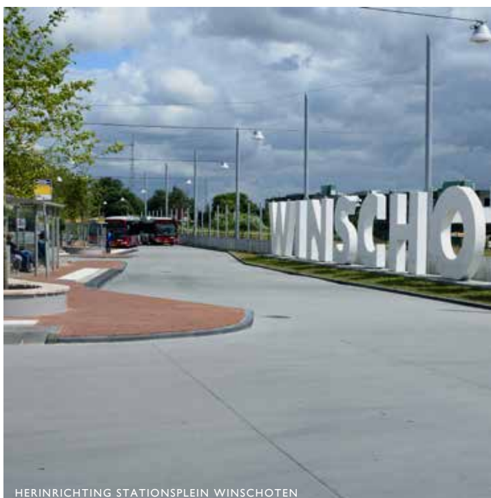
HERINRICHTING STATIONSPLEIN WINSCHOTEN