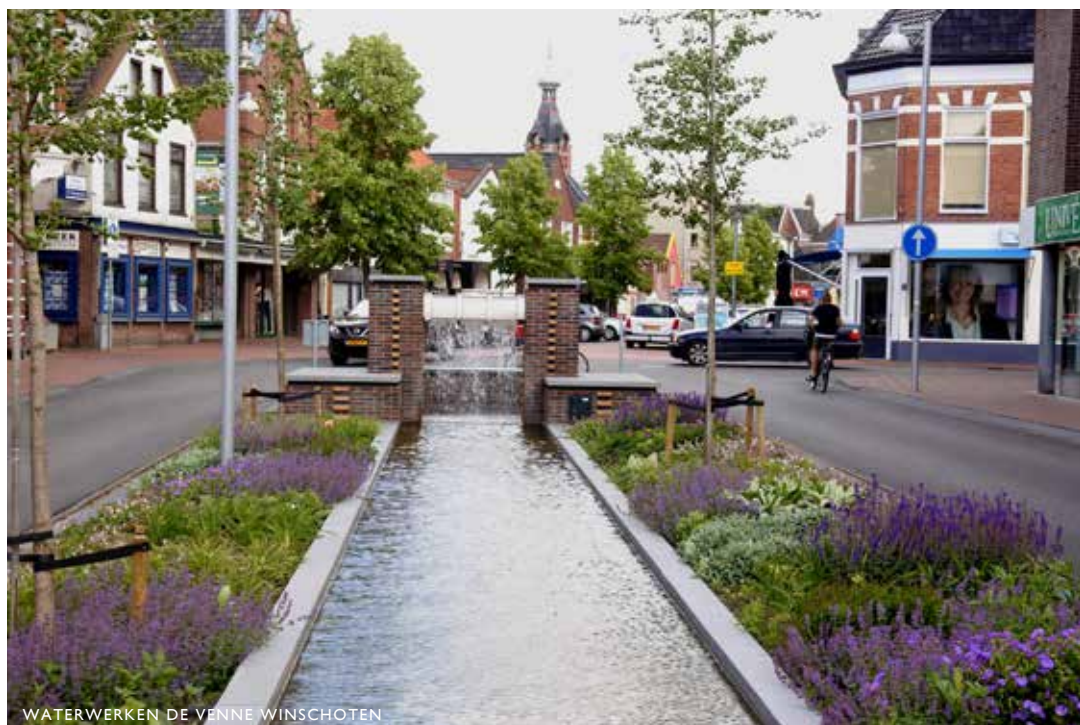
WATERWERKEN DE VENNE WINSCHOTEN