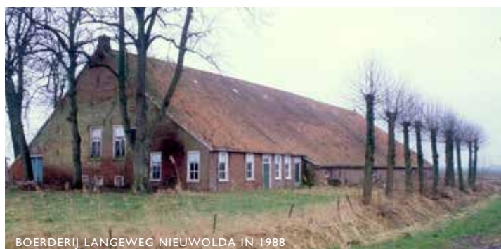
BOERDERIJ LANGEWEG NIEUWOLDA IN 1988