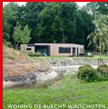
WONING DE BURCHT WINSCHOTEN