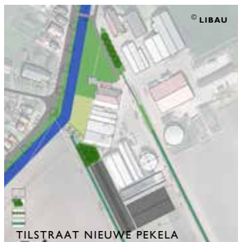
TILSTRAAT NIEUWE PEKELA