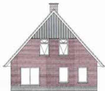
H.B. HULSMANSTRAAT NIEUWE PEKELA