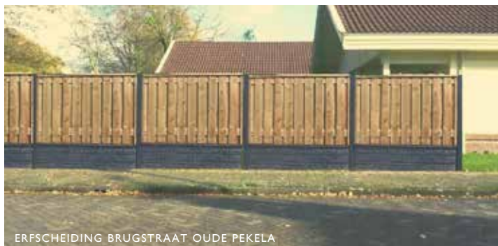
ERFSCHIEDING BRUGSTRAAT OUDE PEKELA