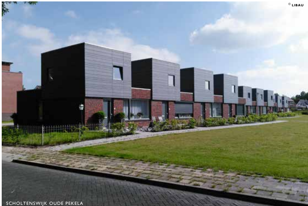
SCHOLTENSWIJK OUDE PEKELA