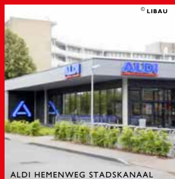
ALDI HEMENWEG STADSKANAAL