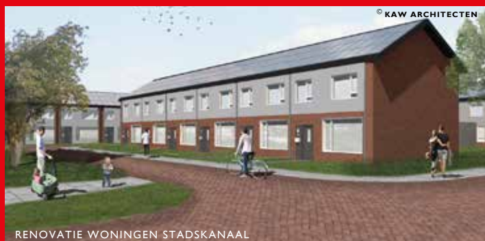
RENOVATIE WONINGEN STADSKANAAL