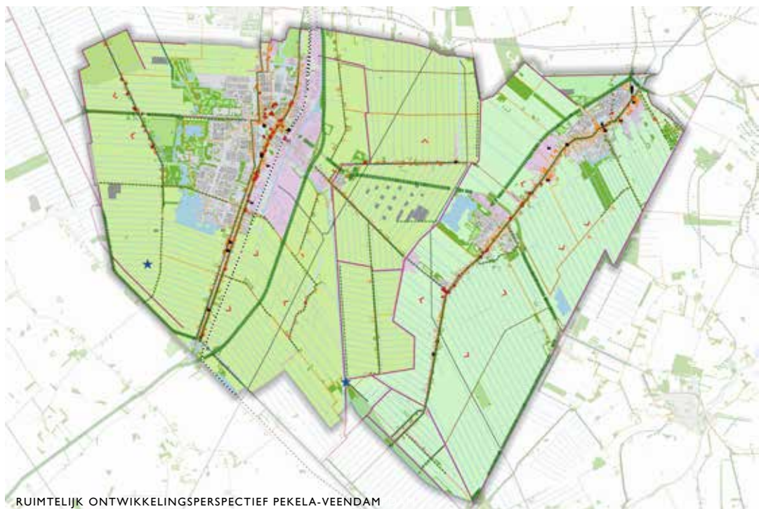
RUIMTELIJK ONTWIKKELINGSPERSPECTIEF PEKELA-VEENDAM