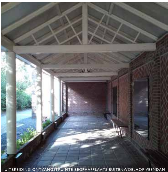
UITBREIDING ONTVANGSTRUIMTE BEGRAAFPLAATS BUITENWOELHOF VEENDAM