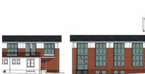
UITBREIDING POSTKANTOOR BENEDEN OOSTERDIEP VEENDAM