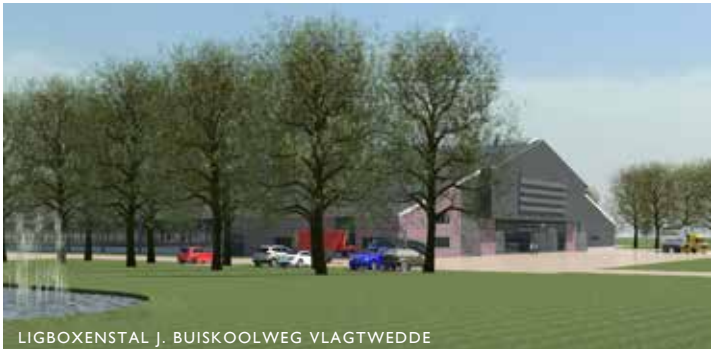
LIGBOXENSTAL J. BUISKOOLWEG VLAGTWEDDE