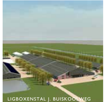
LIGBOXENSTAL J. BUISKOOLWEG