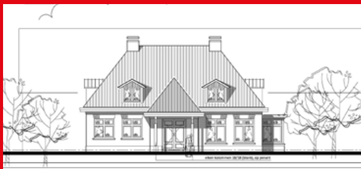
WONING VOOR LOODS ACHTER MATEN TER APEL

vervanging van deze boerderij door een woonhuis. Dit laatste volgde niet de contouren van de voormalige boerderij, wat in dit gebied een eis is. De welstandscommissie gaf bovendien aan dat het woonhuis uit te veel onderdelen bestond en niet de heldere opzet van de bestaande boerderij benaderde. Zij stelde dat de opgave dermate gecompliceerd is dat een helder ontwerp op deze bijzondere plek noodzakelijk is.