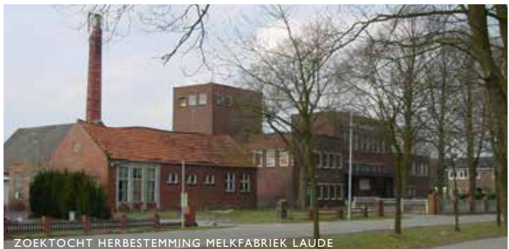
ZOEKTOCHT HERBESTEMMING MELKFABRIEK LAUDE