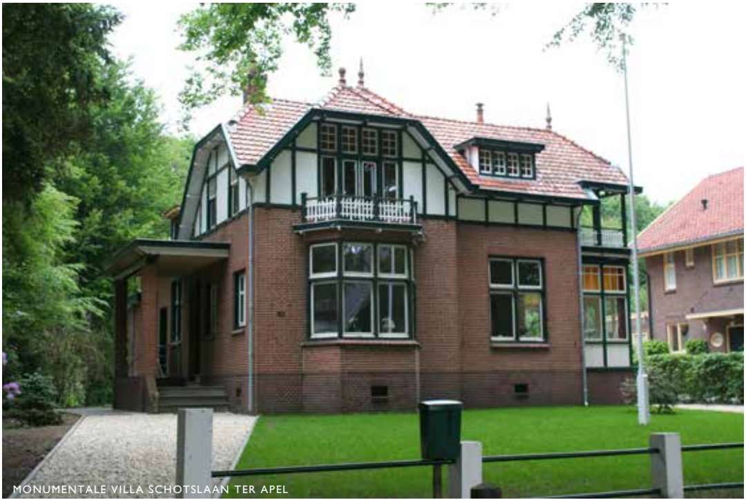
MONUMENTALE VILLA SCHOTSLAAN TER APEL