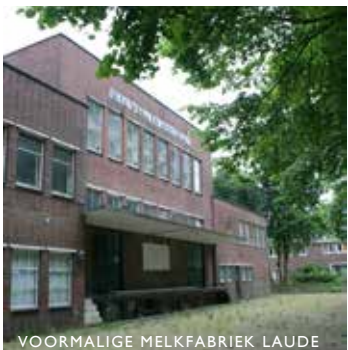
VOORMALIGE MELKFABRIEK LAUDE