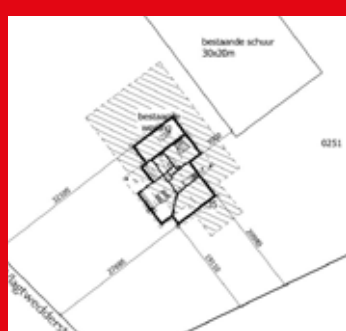
CONTOUR BOERDERIJ MET WONING