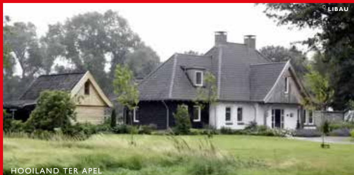
HOOILAND TER APEL

Sellingen leidde tot het advies van de welstandscommissie om hierin nog een aantal verfijningen aan te brengen. De woning krijgt een half verdiepte parkeerkelder, wat mogelijk is doordat deze tegen de zandrug wordt gebouwd. De toegangswanden hiervan worden op advies van de commissie met metselwerk bekleed.