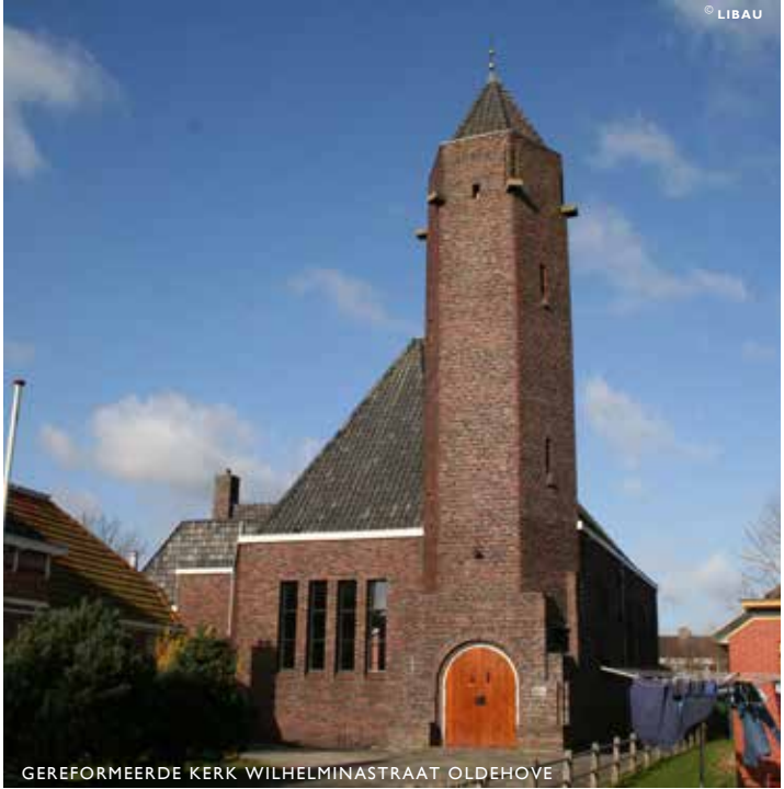
GEREFORMEERDE KERK WILHELMINA STRAAT OLDEHOVE