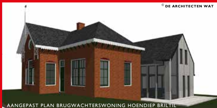
AANGEPAST PLAN BRUGWACHTERSWONING HOENDIEP BRITIL