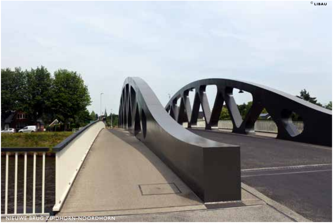
NIEUWE BRUG ZUIDHORN-NOORDHORN