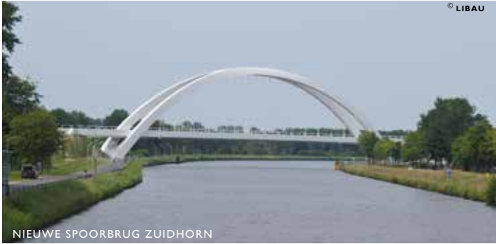
NIEUWE SPOORBRUG ZUIDHORN